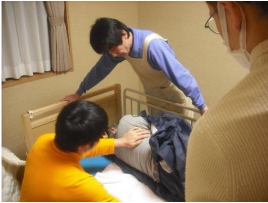
洋服の着脱にしても、実際に「着せられてみる」 ことでどうすれば着心地よくお着替えができる か、よりよい方法がわかってきます。同時にベテ ラン・新人に限らずお互いの気づきを話し合いま す。こうした機会を多く持つことでスタッフ全員 の介護技術が平均化することも期待できます。

介護に「慣れ」は禁物です。経験を積むに したがって、自分にとってやりやすい方法を 使うようにもなってきましたし、スタッフそれ ぞれの「くせ」も出てきます。それぞれの作 業に「雑さ」も生じてきます。それは介護者 本位の介護であり、ご利用者様にとって心地 よい介護ではなくなります。倶楽部千代田會 館では時々スタッフ同士で勉強会を開き、適 正な身体介護が出来ているかどうかお互いに 確かめます。介護「される」側を体験す ると、仮に教科書通りに適正な介護を行って いたとしても、実際はこんなに介護される方 に不快な思いや恐怖感を抱かせてしまってい たのかということに気が付かれます。