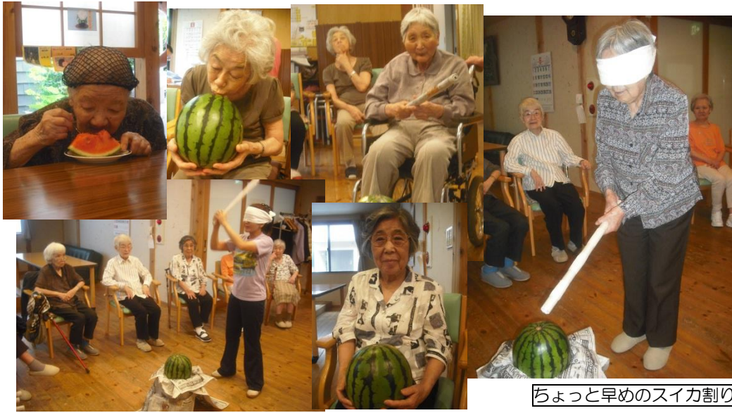
ちょっと早めのスイカ割り