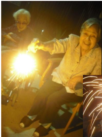
過ぎゆく夏を惜しむようにみんなで花火をやりました

いかがでしたか？ 余計な文章を書くよりも皆さんの表情で楽しい夏を過ごしていただけたのがわかると思えます。来月は千代田會館のお祭りです。またお会いしましょう。 (注：担当者が手を抜いて、何も文章を書かなかったのではありませんよ……笑)