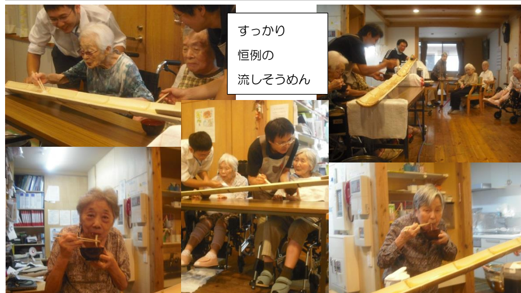
すっかり 恒例の 流しそうめん