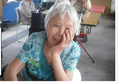
やよいほうむのお祭りに参加しました

いかがでしたか？ 余計な文章を書くよりも皆さんの表情で楽しい夏を過ごしていただけたのがわかると思えます。来月は千代田會館のお祭りです。またお会いしましょう。 (注：担当者が手を抜いて、何も文章を書かなかったのではありませんよ……笑)