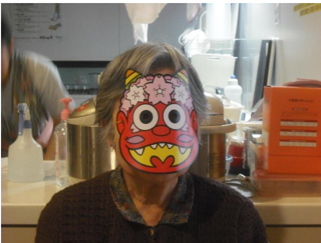
ずいぶん優しい赤鬼さんですこと

節分には豆を撒き、撒かれた豆を自分の年齢(数え年)の数だけ食べますね。豆は、「穀物には生命力と魔除けの呪力が備わっている」という信仰があるようで、または語呂合わせで「魔滅」(まめつ)に通じ、鬼に豆をぶつけることにより、邪気を追い払い、一年の無病息災を願うという意味合いがあります。