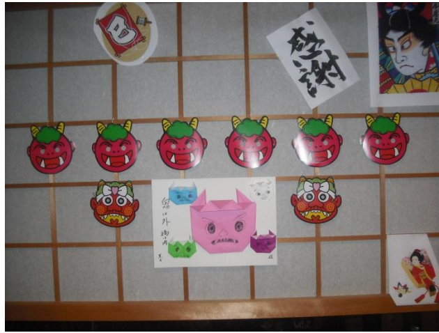
玄関から入って正面にある障子には最近季節感のある飾りつけをしています。2月は節分の飾りつけを手作りしました。かわいい鬼さんです。

節分には豆を撒き、撒かれた豆を自分の年齢(数え年)の数だけ食べますね。豆は、「穀物には生命力と魔除けの呪力が備わっている」という信仰があるようで、または語呂合わせで「魔滅」(まめつ)に通じ、鬼に豆をぶつけることにより、邪気を追い払い、一年の無病息災を願うという意味合いがあります。