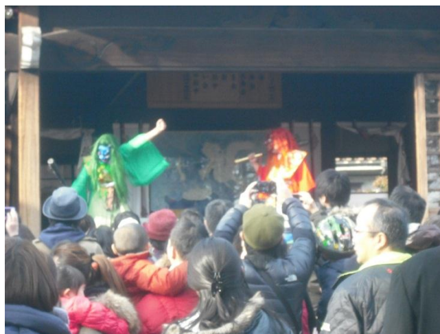
氷川神社の豆まきに参加しました。今年の節分は日曜日と重なったこともあり、神社の中は子供たちであふれていました。私たちも負けずにお菓子をゲットできました。

今年の節分は日曜日と重なり、また陽気が良かったこともあり、近所の氷川神社で行われた節分祭りに参加させていただく事にしました。壇上から年男、年女の皆さんが盛大に豆やお菓子をまいてくださいました。あぶないから私が代わりに受け取ってきますよと声を掛ける間もなく、お祭り好きのご利用者様が人の波に飛び込んで、お菓子をキャッチし